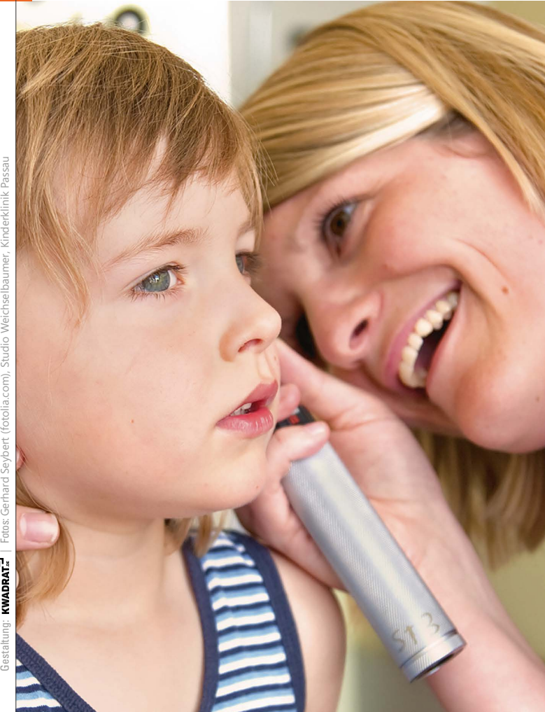
Gestaltung: KWADRAT

Förderprogramm mit freundlicher Unterstützung durch die Stiftung Kinderlächeln